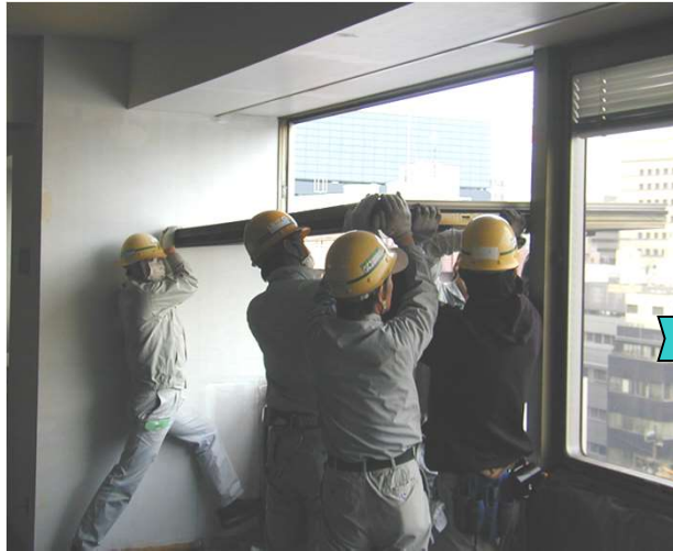
1,障子を90° 回転させて持ち上げピボットヒンジ部に治具をセットする