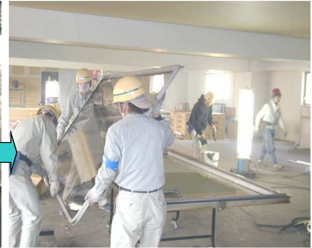
3,外障子を開き、内障子から分離する