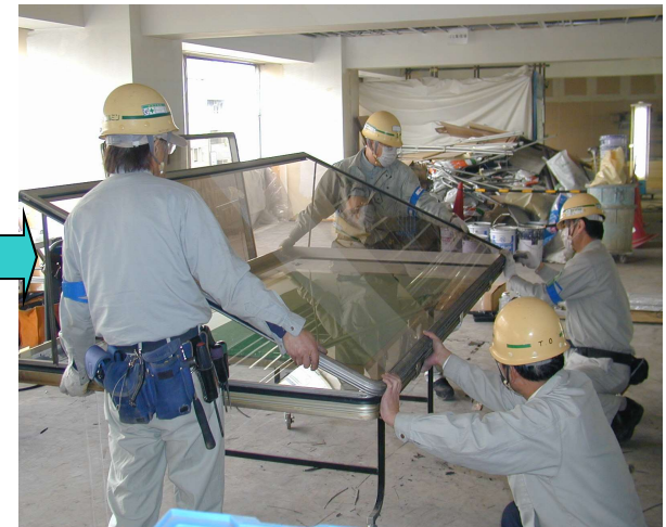
18,内障子に外障子を組み付けて障子の作業完了