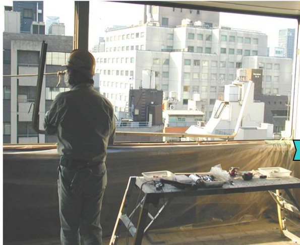
19, 枠のピボットヒンジを外し枠ウェザリングを外す