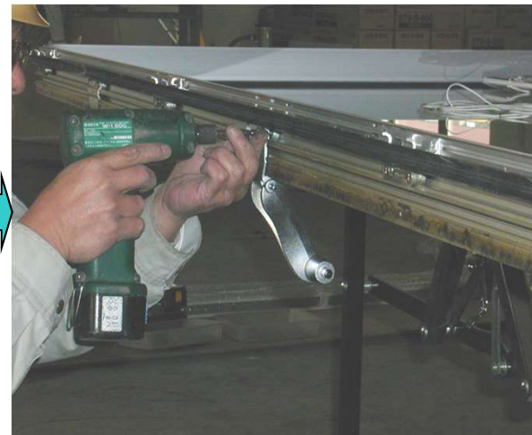
17,リンケージロックを外し、新規リンケージロックを取り付ける