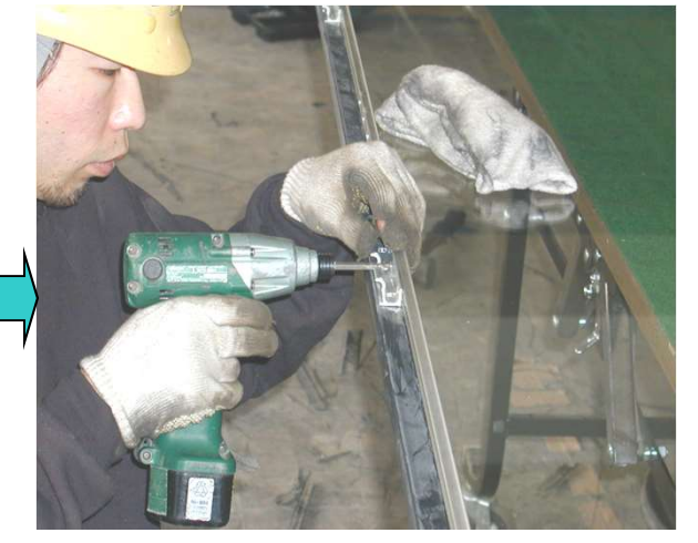
6,ベントヒンジ(4個)を取り替える