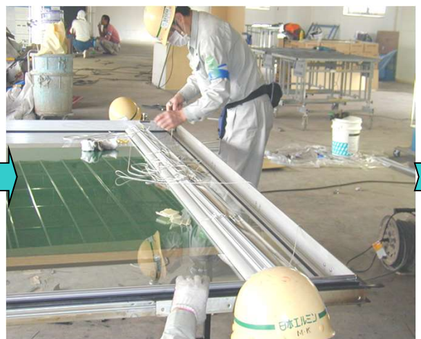
11,新規ブラインドを取付しブラインドクリップをセットする