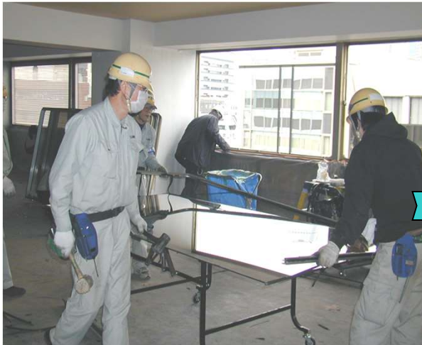
13,外障子をばらしてグレージングビートを外す