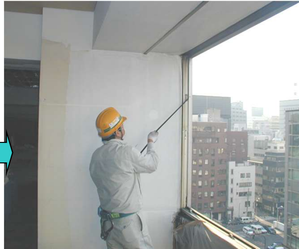
20, 四周のウェザーシール(タイト材)を外す