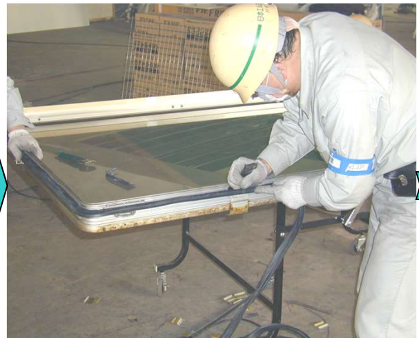
5,新規インサイドベントウェザーストリップを取り付ける