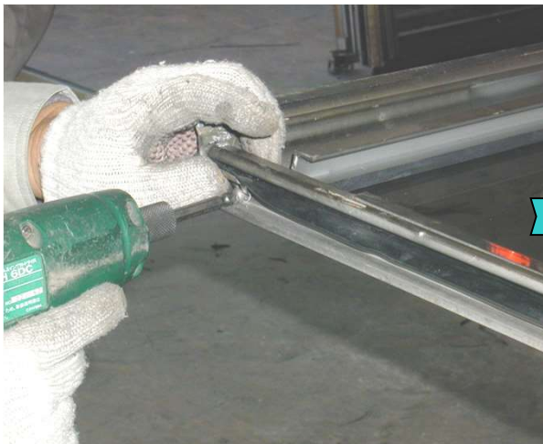
16,外障子にレインバリア(1次止水ゴム)および押さえ金具を新規に取り付ける