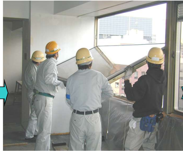
2,障子を室内側に引き抜き作業台に載せる