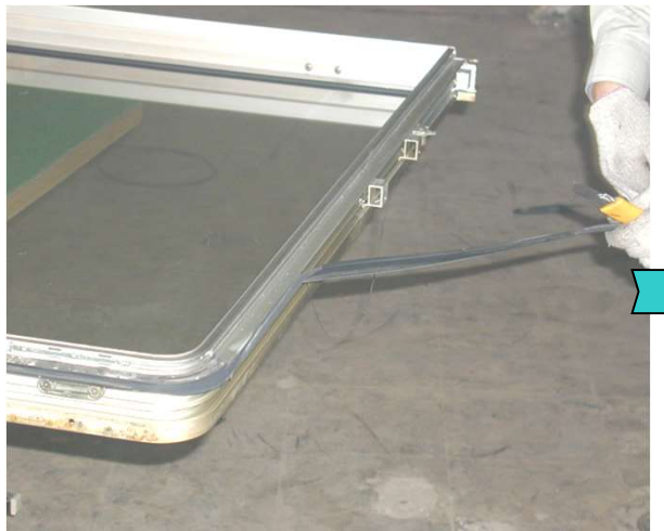
4,内障子のインサイドベントウェザーストリップ(タ付材)を外す