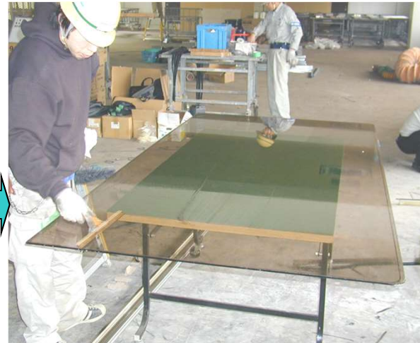
14,外ガラスのクリーニングを行う