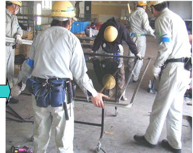
15,外障子の周りに新規グレージングビートを巻き、障子を組み立てする