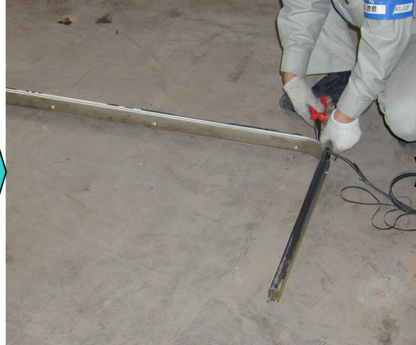
23, 外したウェザリングのタイト材を取り除き、新規のタイト材を取り付ける