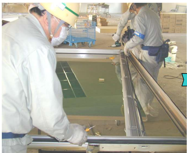
10,ブラインドクリップを外し、ブラインド本体を外す