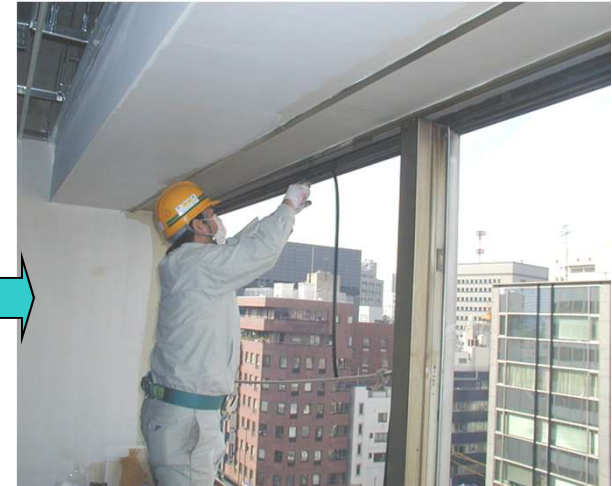
21, 新規ウェザーシールを取り付ける