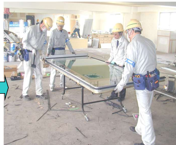
9,ガラスに新規グレージングビートを巻き、内障子を組み立てる