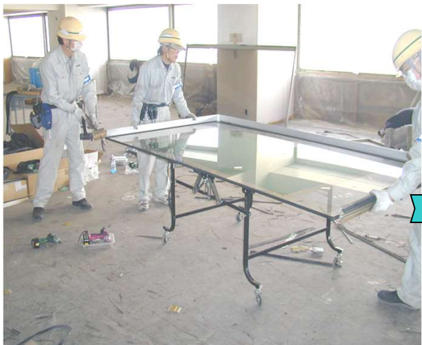
7,内障子をばらしてグレージングビートを外す