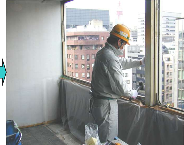
24, 枠ウェザリングを取り付けるピボットヒンジを取り付けて枠の作業完了