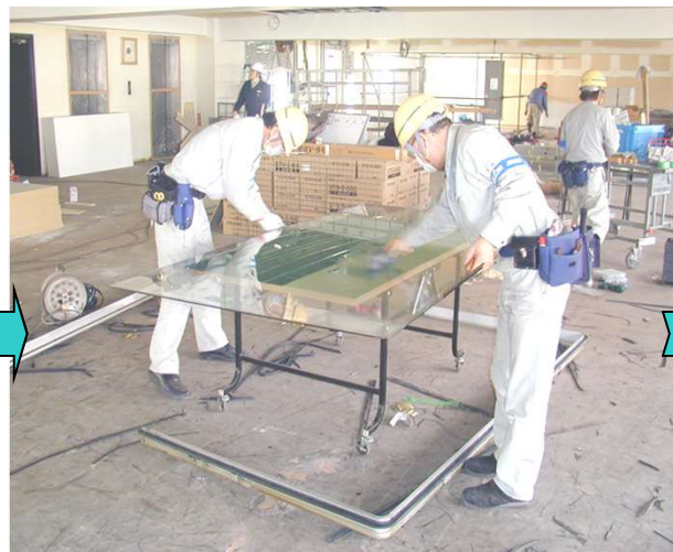
8,内ガラスのクリーニングを行う