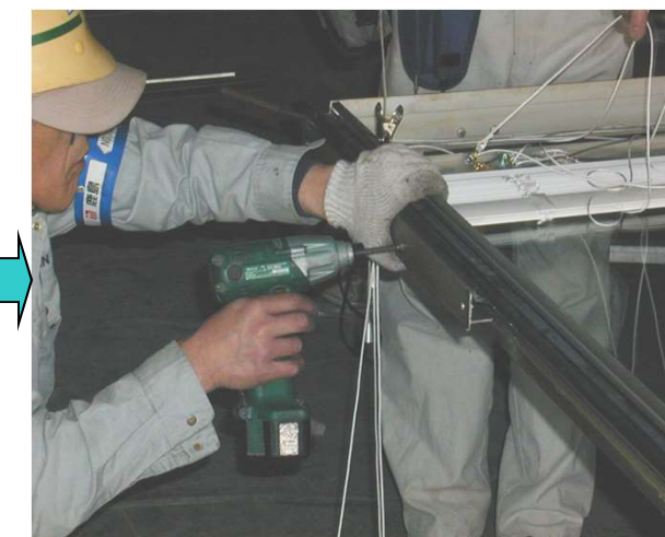
12,障子ウェザーリングを外しタイト材を入れ替え内障子に組み付ける